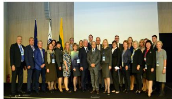
Teilnehmer der Diskussion am runden Tisch in Vilnius

Ich hatte Gelegenheit, eine kurze Präsentation zum Thema „Die alternde Bevölkerung – eine Herausforderung für die heutige Zahnmedizin in Europa“ zu halten. Darin machte ich deutlich, dass sich die ERO mit dieser Thematik beschäftige und eine Arbeitsgruppe unter dem Vorsitz von Philippe Rusca gegründet worden sei, um die gegenwärtige Situation in Europa zu analysieren und einen Vorschlag zu unterbreiten, wie dies aus Sicht der Zahnärzteschaft bewältigt werden könne. Des Weiteren wies ich darauf hin, dass die FDI die Mundgesundheit der alternden Gesellschaft auf dem Zahnärztekongress in Madrid in einem separaten Symposium ebenfalls thematisiert habe.